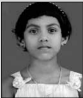
ഈയ മേരി ഫിലിപ്പ് സെന്റ് ജോർജ്ജ് പിരളശ്ശേരി ലളിതഗാനം ഭദ്രാസനം & സോണൽ - 1st